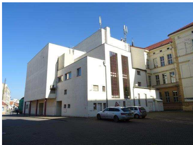
foto /1/ Pohled na objekt

Stavebními úpravami navrženými v této projektové dokumentaci dochází k rekonstrukci střešního pláště – obnově hydroizolační funkce střechy. Projektová dokumentace je navržena tak, aby splňovala podmínky stanovené oborem památkové péče. Účel objektu se nemění a nemění se ani účel využití ostatních prostorů v budově.