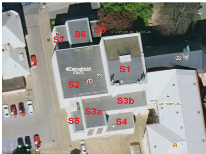
obr. /1/ Situace objektu s vyznačením provedených sond (označení jednotlivých střech)

Všechny střechy jsou jednoplášťové s hlavní hydroizolační vrstvou (krytinou) tvořenou asfaltovým pásem. Hydroizolace je pravděpodobně kotvena.